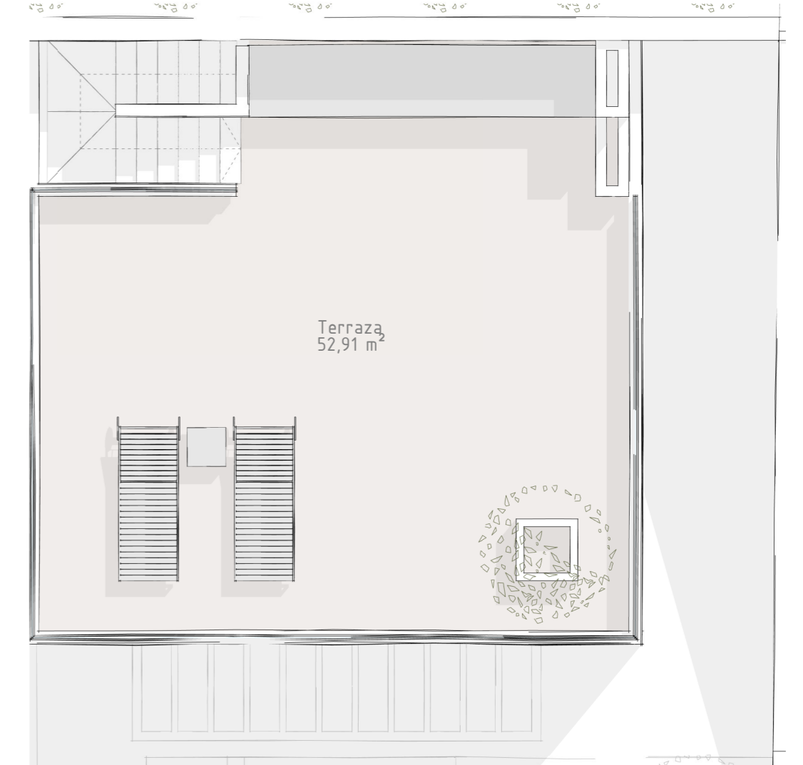
1.Viv. Unifamiliar. Terraza