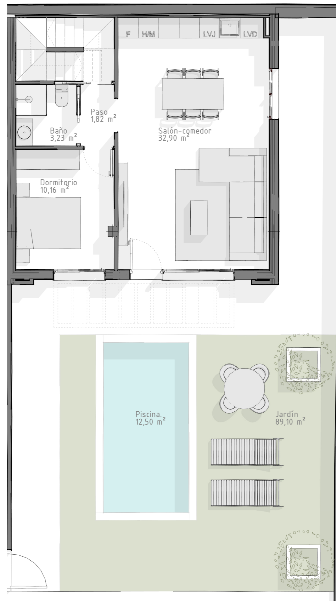
1.Viv. Unifamiliar. Planta baja